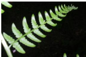
Détail de la fronde