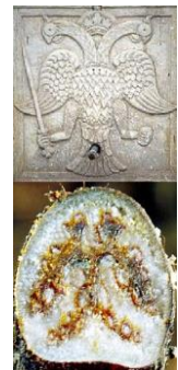
Symbole byzantin de l'aigle à 2 têtes et section de la tige